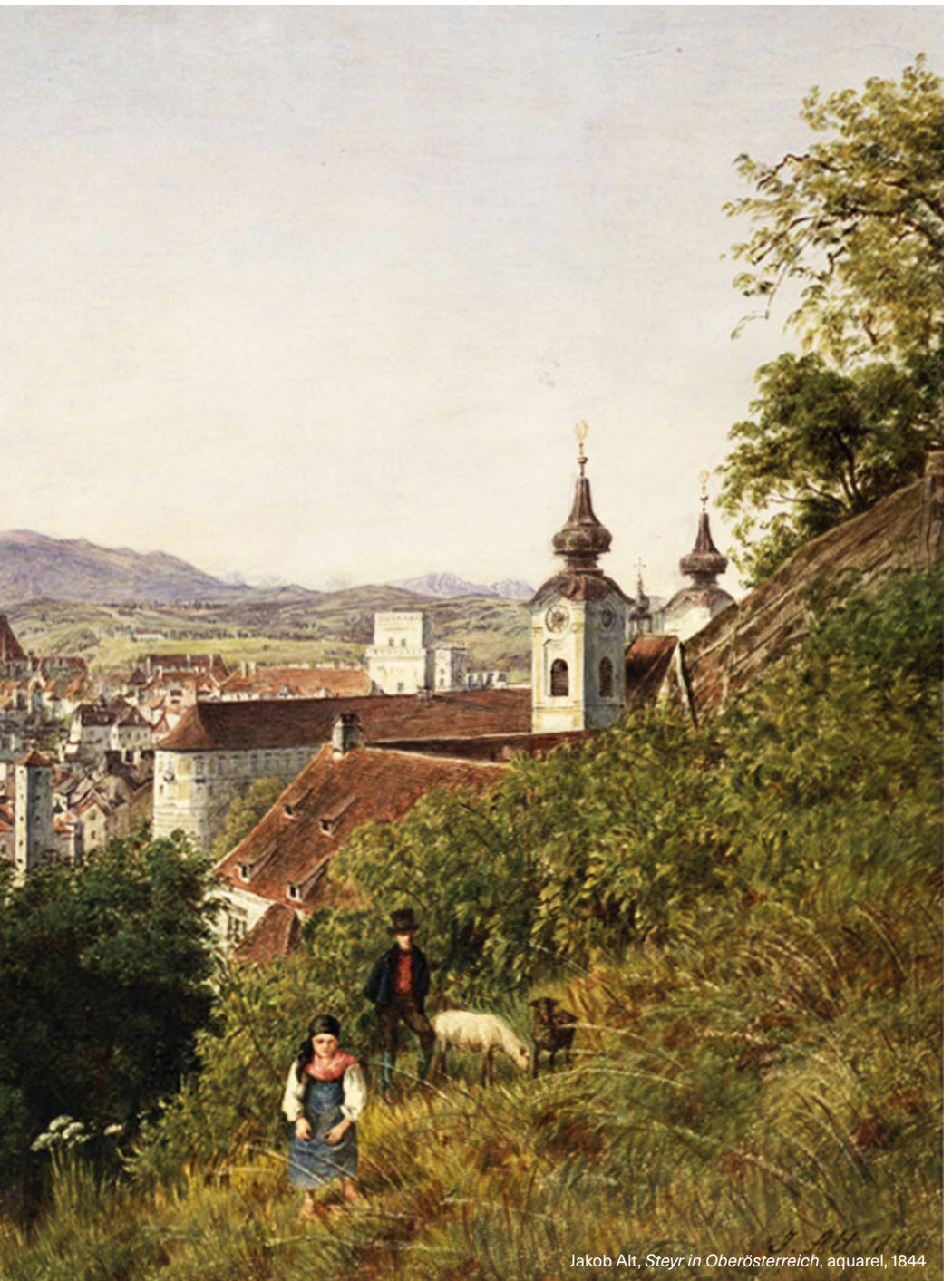
Jakob Alt, Steyr in Oberösterreich , aquarell, 1844